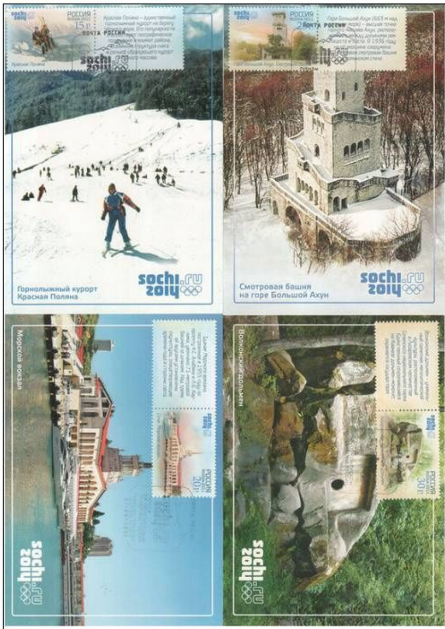
K tejto emisii boli vydané tieto krásne 4 maxikarty