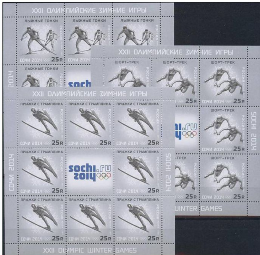
К XXII. ZOH boli vydané aj tieto tlačové listy a známky s vyobrazením behu na lyžiach, short-treckom a skokmi na lyžiach